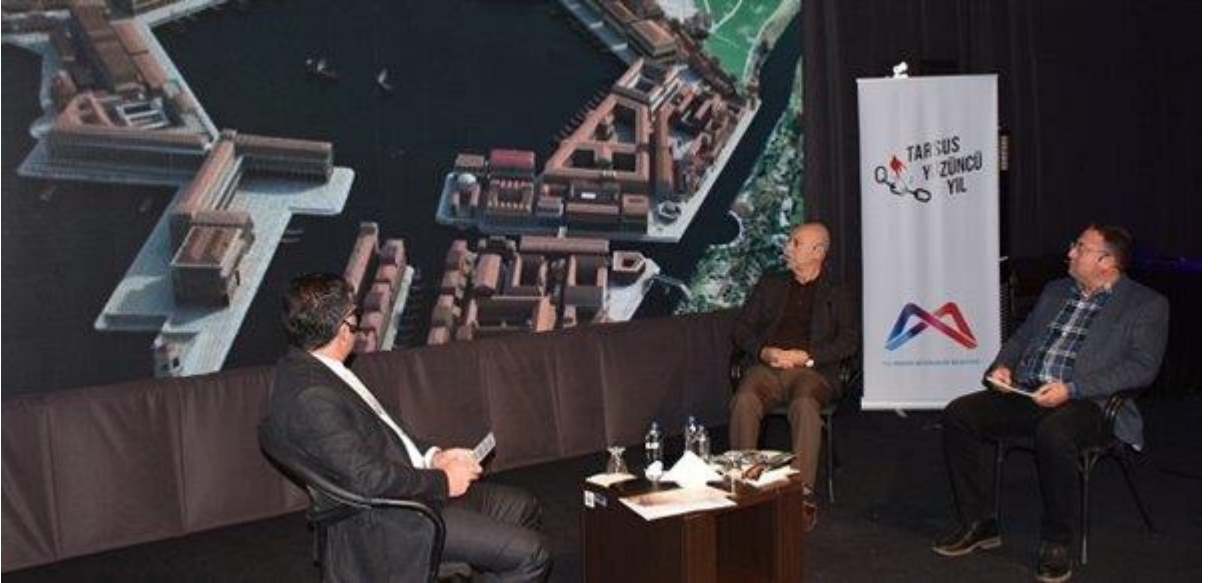
100 yıllık süreçte Tarsus Ticareti anlatıldı, .

Mersin'in Tarsus ilçesinin düşman işgalinden kurtuluşunun 100. Yıldönümü etkinlikleri kapsamında, Tarsus'un 100 yıllık süreçteki ticareti anlatıldı.