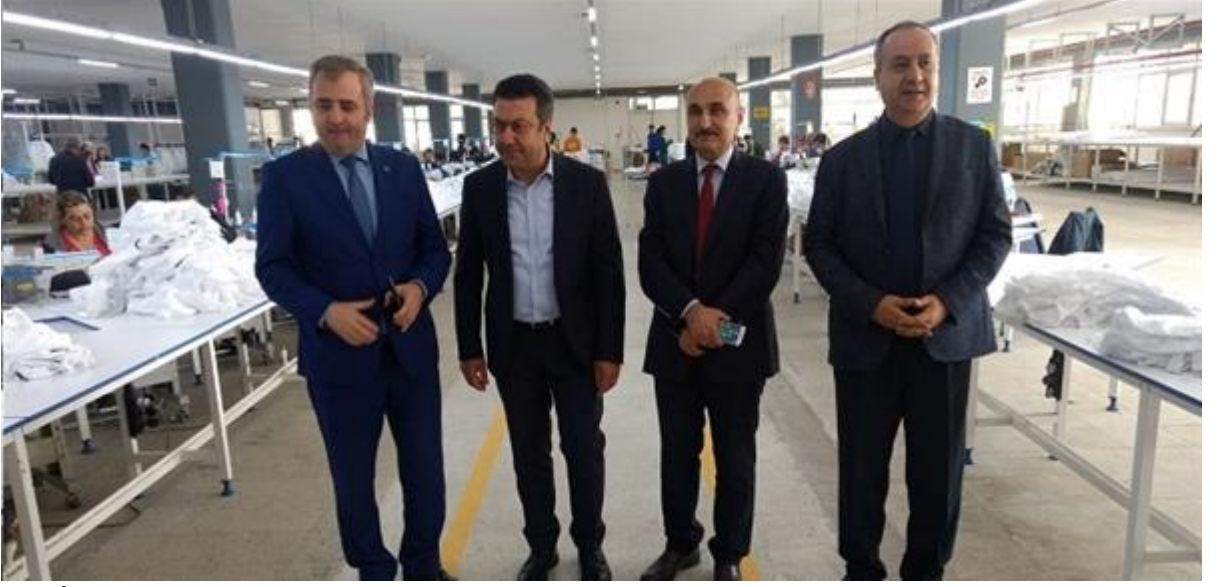
MEGİP Kursu Açılışı, .

Türkiye İş Kurumu (İŞKUR) ile Türkiye Odalar ve Borsalar Birliği (TOBB) arasında 2017 yılının sonunda hayata geçen Mesleki Eğitim ve Beceri Geliştirme İşbirliği Protokolü (MEGİP) çerçevesinde Tarsus'ta açılan çeşitli kurslar sonunda 200'e yakın işsize iş imkanı yaratıldı.