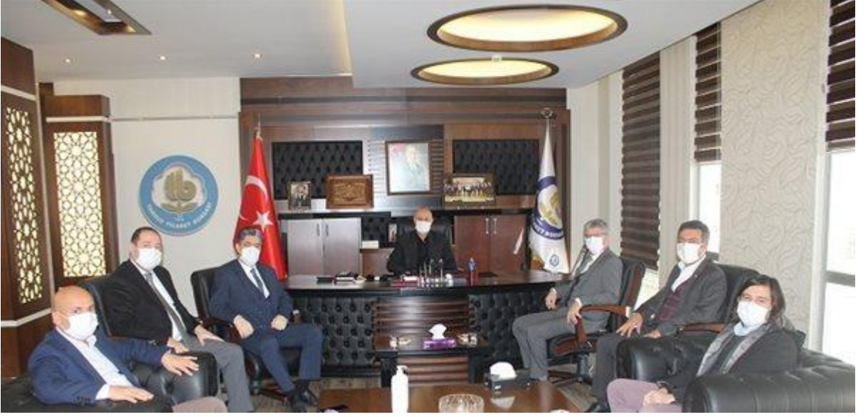
Borsa ve Ziraat Bankası ile Bankkart Tedarik Zinciri Finansman Protokolü İmzalandı, .