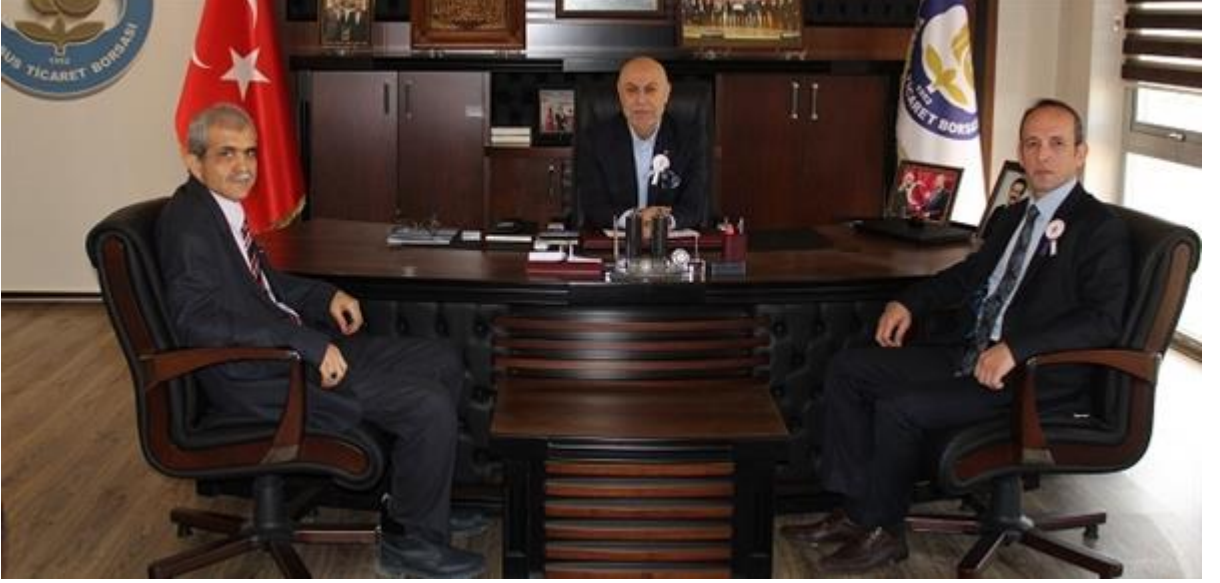
Vergi Haftasında Daire Müdürlerinin Ziyareti, .

İlke 10 İş dünyası, rüşvet ve haraç dahil her türlü yolsuzlukla savaşmalı.