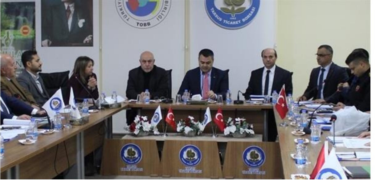
Büyük İlçeler Güven ve Dönüşüm Projesi Tanıtımı Yapıldı, .

Türkiye İş Kurumu (İŞKUR) ile Türkiye Odalar ve Borsalar Birliği (TOBB) arasında 2017 yılının sonunda hayata geçen Mesleki Eğitim ve Beceri Geliştirme İşbirliği Protokolü (MEGİP) çerçevesinde Tarsus'ta açılan çeşitli kurslar sonunda 200'e yakın işsize iş imkanı yaratıldı.