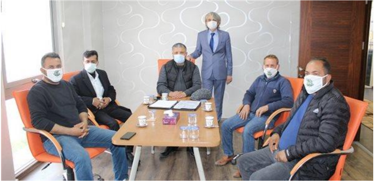
Tarım İşverenleri ile Tarsus Paketleme ve Tarım İşçileri Derneği Ücrette Anlaştı,.