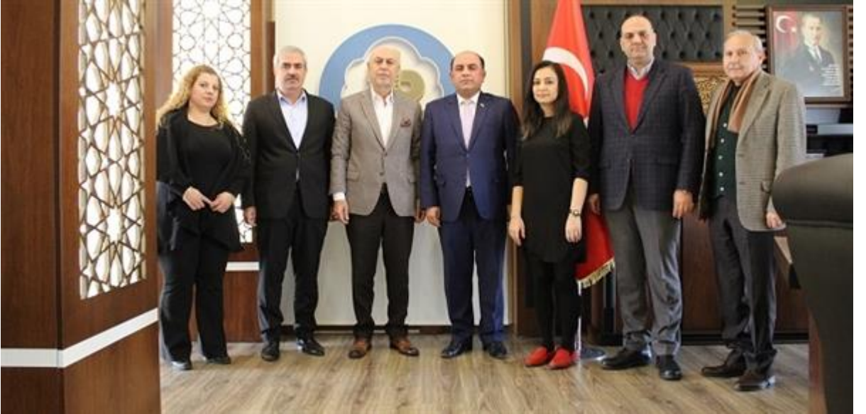
Tarsus, Irak Temasında, .

Değerli iş insanlarımızın ve mükelleflerin ilçemizde devletine karşı sorumluluk duygusu içinde hareket ederek; ödediği vergiler, yaptığı yatırımlar ve sağladığı istihdam ile Tarsus'umuzun ve dolayısı ile ülkemizin gelişimine büyük katkıları bulunmaktadır.