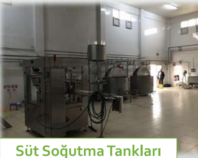
Süt Soğutma Tankları