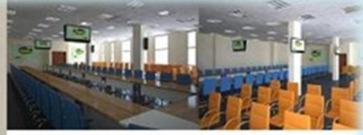
TARSUS TİCARET BORSASI SATIŞ SALONU